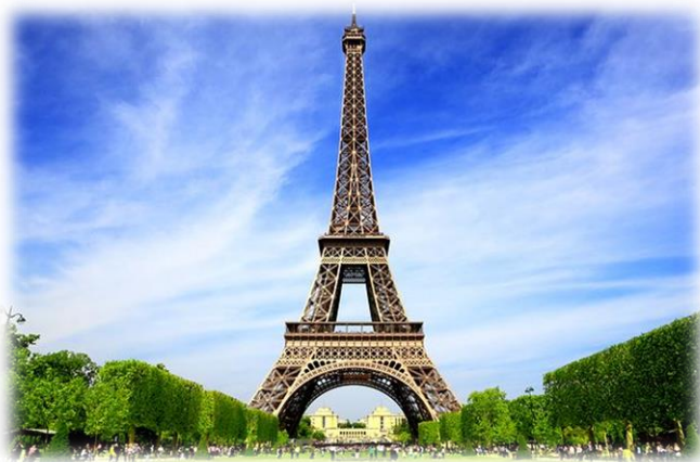
Wież Eiffla - Francja