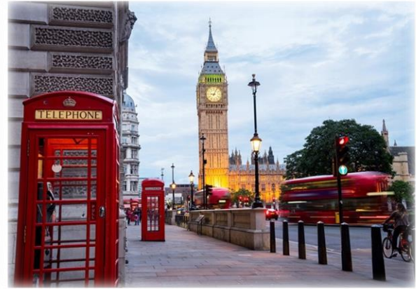
Big Ben - Anglia

Zadanie 12. Utrwalamy literę „P” - „P” jak Polska.