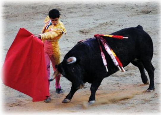
Corrida - Hiszpania