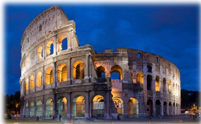
Koloseum - Włochy