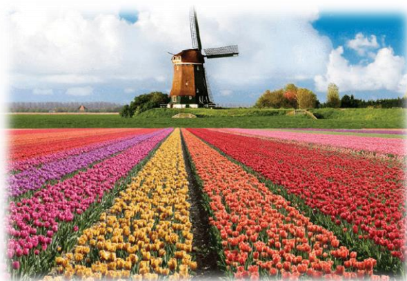
Tulipany i wiatraki - Holandia