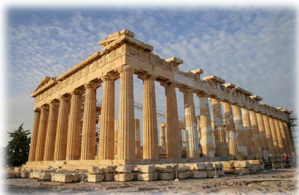
Akropol - Grecja